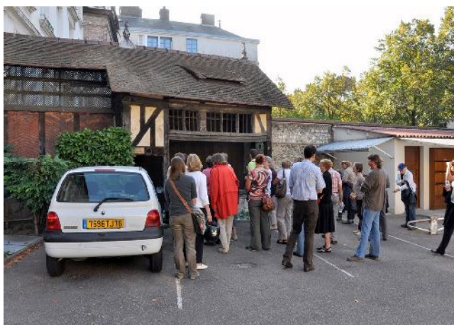
Échoppe gothique provenant de la rue des Boucheries Saint Ouen, 74 avenue Gustave Flaubert.

Un grand merci aux guides conférenciers d'un jour pour leur disponibilité